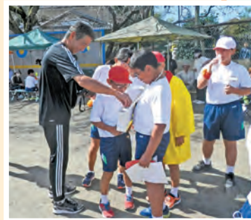
小学校における募金活動