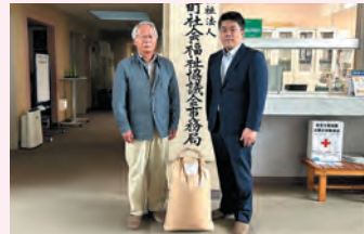
連合栃木 芳賀地協 様