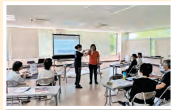
幼児安全法講習会の開催

自治会、個人の皆さまからご協力をいただきました。 町内及び栃木県内における日本赤十字社の活動に活用されました。